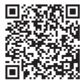
国税庁LINE公式アカウント