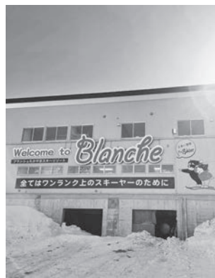
ブランシュたかやまスキー場

答 合併特例交付金を活用した事業が主で、やすらぎの湯周辺の公園と駐車場等の整備である。(抜粋)