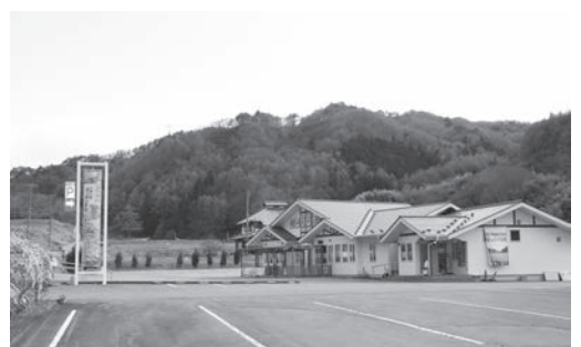
緑の花そば館/信濃霧山ダツタンそば

答 アンケート結果については広報6月号で示す。また、振興公社との指定管理の協議の中で、要望された内容が移管後の新体制で対応可