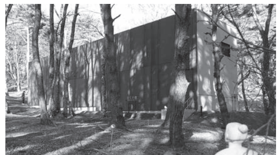
星糞峠黒耀石鉱山野外展示施設「星くそ館」

答 乗車・降車及び運行ダイヤごとに利用者のデータを取っており、令和3年1月に可能な範囲のダイヤ改正を行った。バスを利用する方の意見を聞き、利用しやすいダイヤになるよう10月くらいに改正を行いたいと