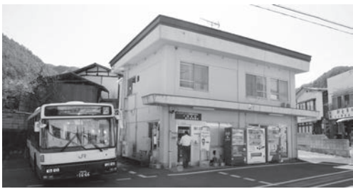
防犯カメラが設置されたJRバス営業所