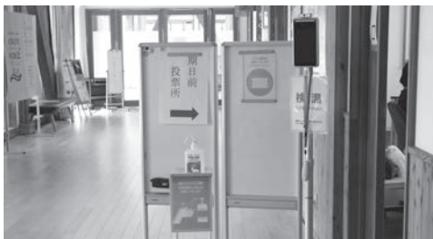
新型コロナウイルス感染症対策