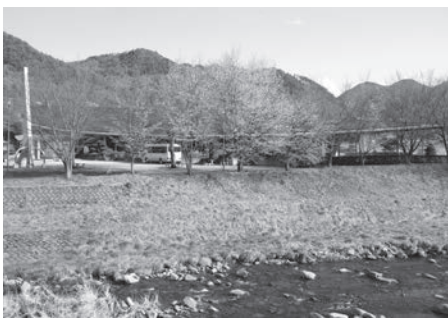
公共施設(和田コミュニティセンター)

答 令和2年度中に、建物に関する個別施設計画がすべてできることから、上位計画である公共施設等総合管