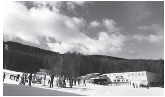
ブランシュたかやまスキー場