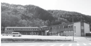
ながわごん、とJRバス