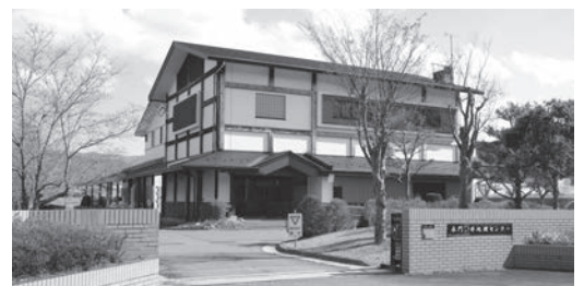
下水処理施設「長門水処理センター」

問 変更前と大きく違う部分は何か。 答 基本的には元の計画をそのままに計画期間を延長している。財政シミュレーションを最新のものにしたことと日本遺産認定などを踏まえ、多少文言等を追記、修正した。(抜粋)