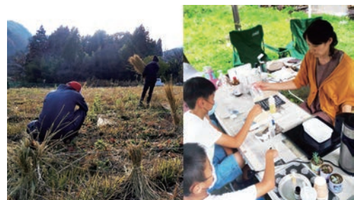
冬の農作業／ワークショップ

1972年北海道函館市生まれ。就職で百貨店に勤務しながら会社の実業団バスケットボールチームに所属。北海道代表国体選手として5年間活躍。その後仕事や転勤などで東京、千葉県へ移住し、アロマセラピーインストラクターの資格を所得。手作り石けんとアロマセラピーの教室を開催し、ものづくりを通じた環境活動やナチュラルライフ研究家として日々の暮らしを楽しむ方法を模索し提案している。