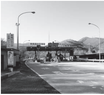
新和田トンネル料金所

県の建設部長と道路建設課企画幹の2名が来庁し話を聞いた。その後、阿部知事からも話があったが、私としては裏切られた感じで、観光の町として本当に厳し