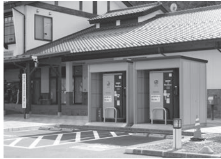
EV充電器(マルメモの駅ながと)