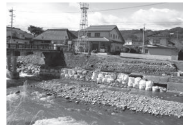
復旧が待たれる被災水路

災害復旧事業 4億2332万円 令和元年の東日本台風によって被災した箇所のうち、令和2年度までに復旧できなかった施設を復旧します。