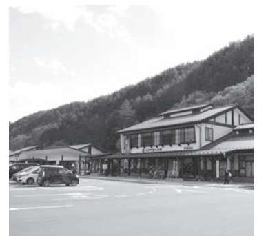
長和町商工会館（道の駅）

道の駅活性化推進事業 1323万円 商工振興資金等制度資金支援 7900万円 ブランシュたかやまスキー場管理事業 2億935万円 新型コロナウイルスの感染拡大に伴う緊急経済対策は、関係する諸団体等と連携し、必要な支援をしていきます。