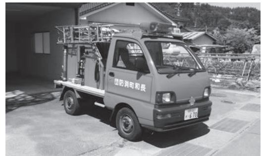
更新される消防団第一分団軽積載車